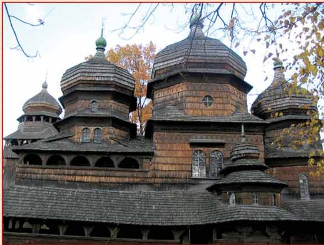
Церква Св. Юра у Дрогобичі Львівської області. Збудована у XV ст., остаточного вигляду набула 1678 р. Славиться своїми унікальними внутрішніми розписами та не менш унікальним іконостасом XVII ст.