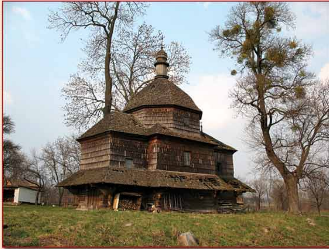
Церква Св. Микити (1666 р.) у с. Дернів Кам'янсько-Бузького р-ну Львівської області. Фахівці вважають її одним із найдосконаліших зразків дерев'яного бароко.