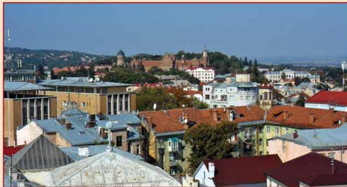
Вид на Чернівці з вежі міської ратуші

Площа нового об'єкту — 8 га, буферна зона — 245 га.